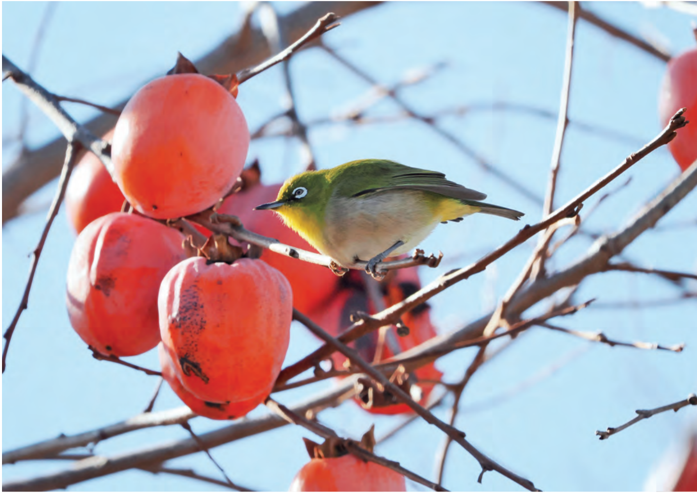
写真コンクール入賞作品