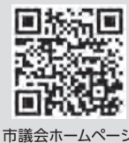
市議会ホームページ