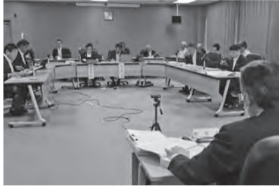
決算審査特別委員会の様子

令和6年度一般会計歳入歳出決算認定については、6人で構成する決算審査特別委員会が9月12日に設置され、24日、25日、26日および30日の4日間にわたり審査されました。同特別委員会で審査された一般会計決算認定議案は、定例会最終日（10月8日）の本会議において賛成多数をもって認定されました。