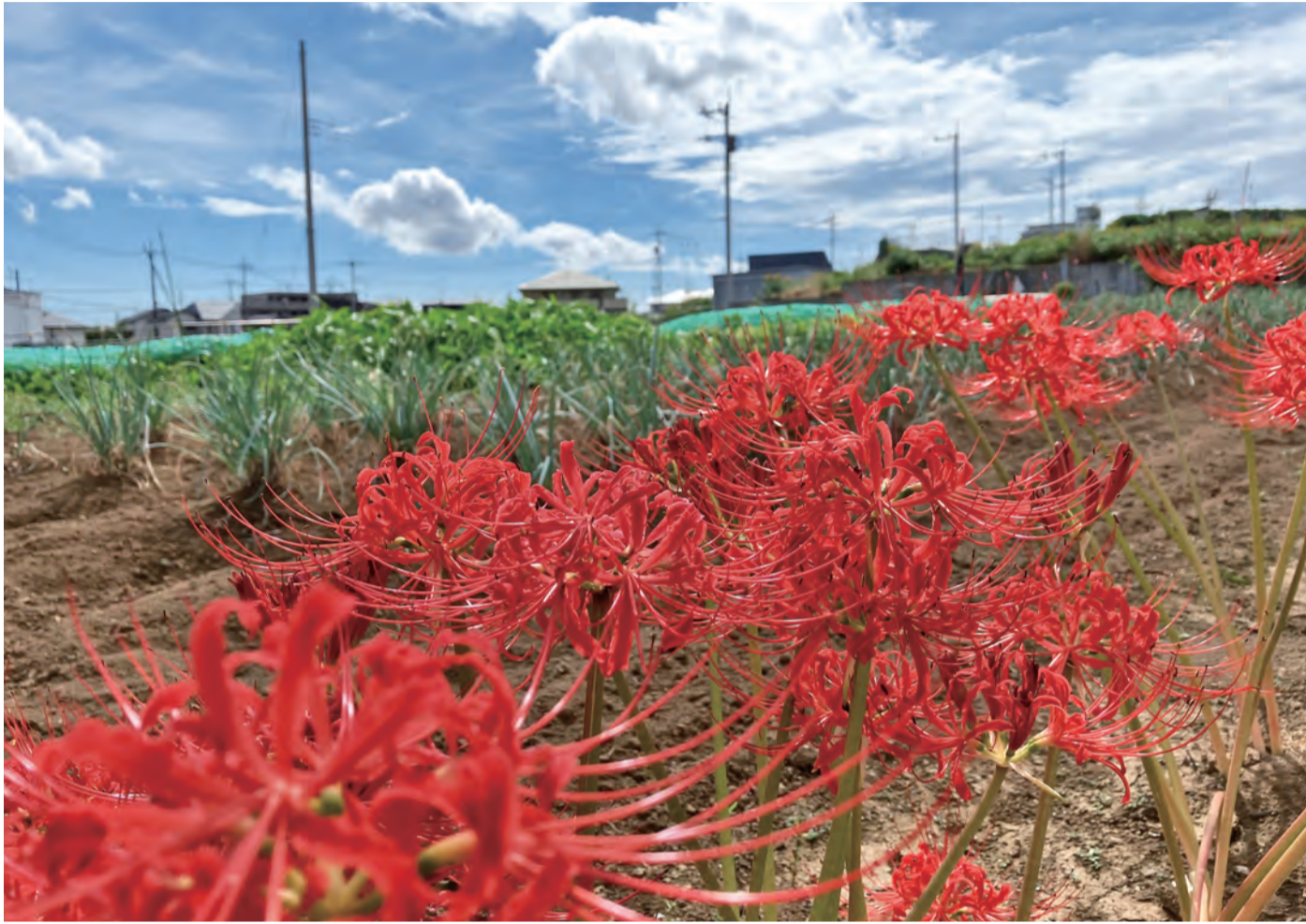
写真コンクール入賞作品