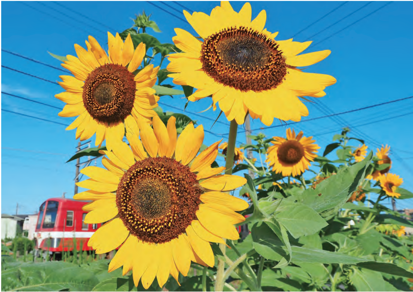
写真コンクール入賞作品