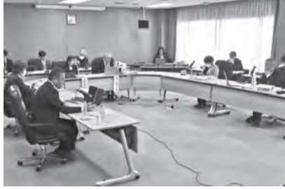
予算審査特別委員会の様子

令和7年度一般会計予算については、6人で構成する予算審査特別委員会が3月3日に設置され、3月10日から12日、および14日の4日間にわたり審査が行われました。その後、3月24日の本会議において、賛成多数をもって原案のとおり可決されました。本会議における一般会計予算に対する、各会派等の意見は次のとおりです。