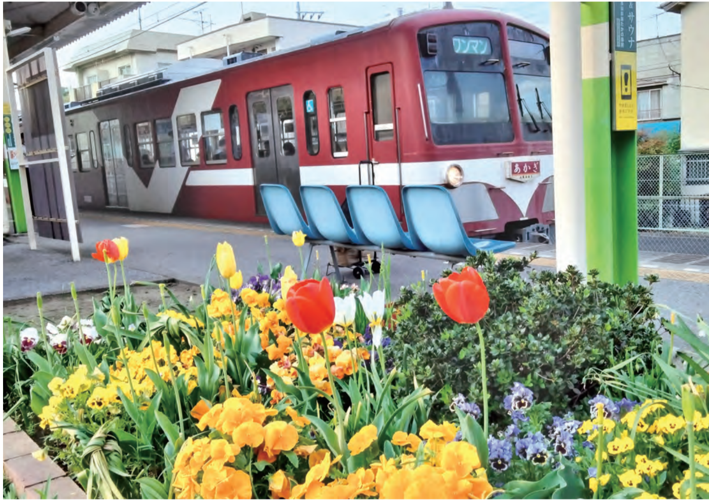
写真コンクール入賞作品 西片 正勝さん撮影の「今日も安全運転」(撮影場所・流鉄鯉ヶ崎駅) 撮影の背景 歴史ある流鉄を美しい花々が見守っているように見え、題名は「今日も安全運転」としました。