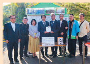
義援金目録を金七能登町議会議長に手渡す坂巻議長（左から4人目）と各会派代表者等