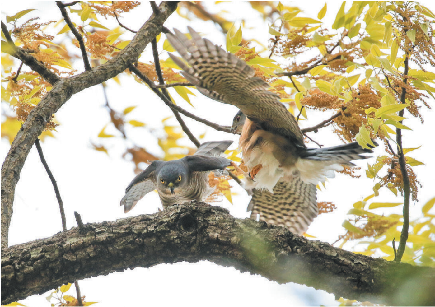
写真コンクール入賞作品 鈴木徳重さん撮影の「出会い」(撮影場所：江戸川台7号公園)