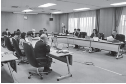
予算審査特別委員会の様子

令和6年度一般会計予算については、8人で構成する予算審査特別委員会が2月26日に設置され、3月5日から7日、および11日の4日間にわたり審査が行われました。その後、3月19日の本会議において、賛成多数をもって原案のとおり可決されました。本会議における一般会計予算に対する、各会派等の意見は次のとおりです。