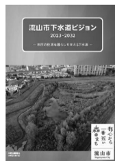
流山市下水道ビジョン

議案第22号～第24号、第26号、陳情第2号 (議案名等については8面をご覧ください。)