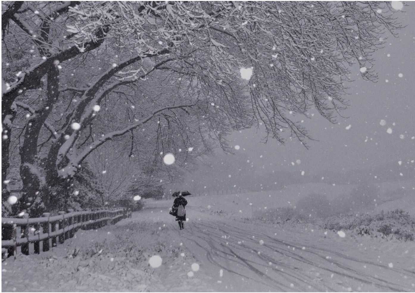
写真コンクール入賞作品 黒沢英雄さん撮影の「雪、さくら」(撮影場所…利根運河) 撮影の背景 令和4年1月6日、午後から流山の利根運河にも雪が降り、一面の雪景色。 薄暮れの風景をフラッシュで人を入れて撮影しました。