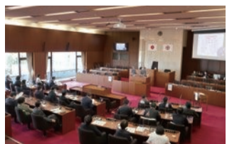
流山市議会 議会中継 検索

午前部・青山講師の録画中継は、市議会ホームページの「議会中継」でご覧いただけます。