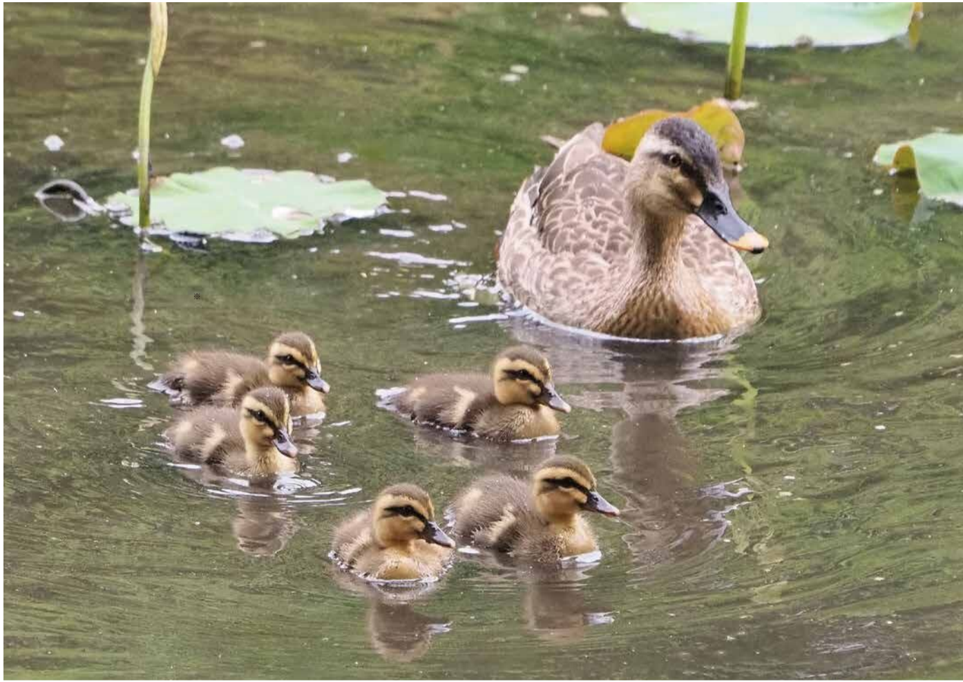
写真コンクール入賞作品 海老原隆司さん撮影の「子育て中」(撮影場所：理窓会記念自然公園) 撮影の背景 お母さんカモがたくさんの子どもを連れて泳ぐ姿が見られました。とても可愛くて、思わずカメラを向けてしまいました。