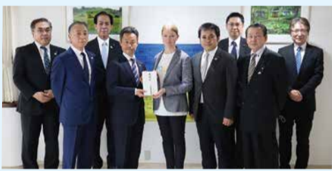
インナ・イリナ三等書記官に義援金をお渡しする正副議長と、有志の議員ら

義援金を受け取った在日ウクライナ大使館のインナ・イリナ三等書記官からは、「隣国に避難しているウクライナ難民の人道支援のために大切に使用