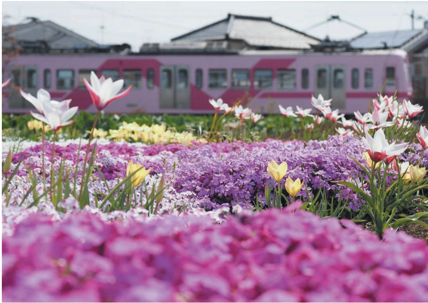
写真コンクール入賞作品 原口孝和さん撮影の「芝桜とチューリップと流鉄さくら号」(撮影場所：西平井) 撮影の背景 西平井調整池近くの畑、春に綺麗な花々が咲き誇ります。育てられた農家の方に感謝し、きれいな花々と流鉄さくら号の写真を撮りました。