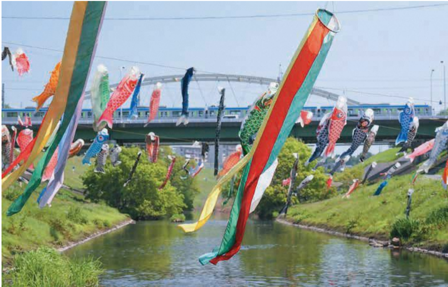
写真コンクール入賞作品 里川 香穂さん撮影の「天まで届け」(撮影場所…東深井)