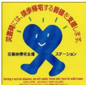
千葉県を含む九都県市が協定を締結