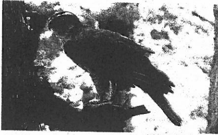
市内で撮影されたオオタカ

オオタカは、平成4年に千葉県内で初めて流山市で繁殖が公表されて以来、市の自然環境の良さの象徴となっています。国が絶滅のおそれのある種のリストで「準絶滅危惧」に指定する希少な鳥で、市内の駅名や学校名などにも名称が使用されています。